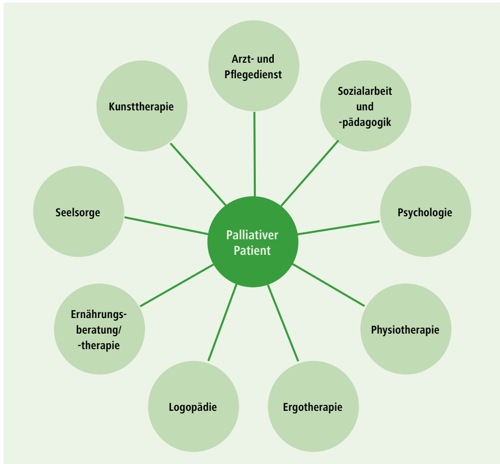
■ Abb. 3: Involvierte Disziplinen auf palliativen Stationen (CHOP 2017)

Die schweizerische Operationsklassifikation (CHOP 2017) hält in Art. 93.8A.2 fest: „Aktive, ganzheitliche Behandlung zur Symptom-